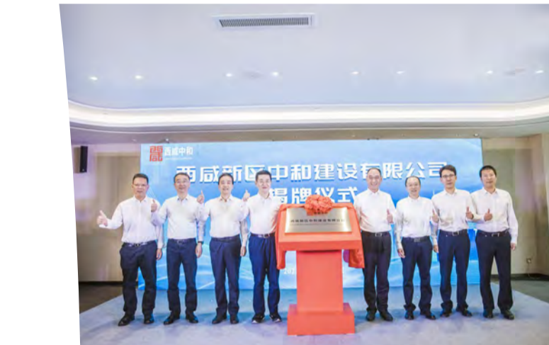
西咸中和建设有限公司在西安揭牌成立

成功应用，预计“十四五”期间，将有序在昌江核电、田湾核电、徐大堡核电以及后续新开核电工程项目中推广应用。数字化技术发展显著，自主研发的“钢筋智能下料数字化技术”，实现智能出图、一键下料，人工效率提升3倍，钢筋损耗降低70%。同时，奋力打造“核工业产业链土建造施工标杆”，系统内率先完成相关施工管理经验汇编。管理创新提质增效，持续推进企业经营平台与项目管理信息化建设，加强项目管理，深化项目组织机构的变革，优化考核方式；持续提升总部能力建设，加快职能管控型与市场经营型运作齐头并进；持续提升二级单位“三项能力”，即区域资源整合能力、分公司本部统筹作战能力和科技创新能力；持续提升财务管理水平，持续拓展融资渠道，保障经营需求。