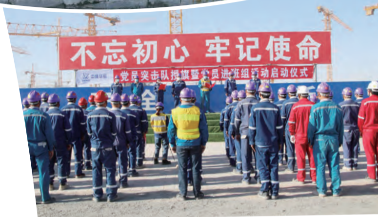
党员突击队授旗暨党员进班组启动仪式

坚持围绕推动企业中心工作做文章、求实效，通过不断夯实“三基建设”，大力加强党风廉政建设，着力破解党建生产“两张皮”，积极探索出“融合”党建工作管理新模式，以“揭榜挂帅”攻坚行动破解关键难题，以“1+5+N”党建品牌矩阵激活高质量发展新动能，将党建引领贯穿于项目建设、思想淬炼、团队精神塑造等方方面面，奋力打造“党建优势转化的标杆”。公司先后荣获中核集团“业绩突出贡献奖”，陕西省“建筑业稳增长工作表现突出企业”，多名员工团体及个人荣获“全国最美家庭”“奋进中核人”等称号，实现了社会效益和经济效益的全面丰收。