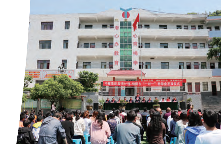
“辰光计划”助力困难学子实现求学梦

理念，铸就了一批精品工程，在奋力打造施工标杆的征程中奋勇前行，先后荣获国家优质工程奖、中国混凝土行业优秀企业等省部级以上奖项100多个。积极深化央地融合，与地方国企合资成立公司，深耕区域市场，陆续开发西咸自由贸易企业服务中心超高层项目、西咸两链融合数字产业园项目、西咸新区铁一金湾中学EPC项目及秦创原·创新生态城EPC项目等陕西区域大型优质项目。