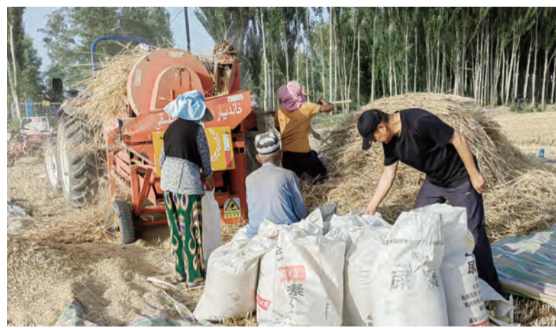
驻村工作队帮助村民收麦子

地处南疆的托万库依拉村一共395户，1824人，留在村里务农的、做小买卖的、外出务工的、读书的、探亲旅游的……每一天，这里都翻滚着浓厚的生活气息。